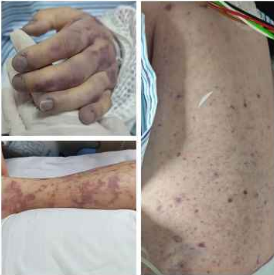
患者身上的瘀点瘀斑